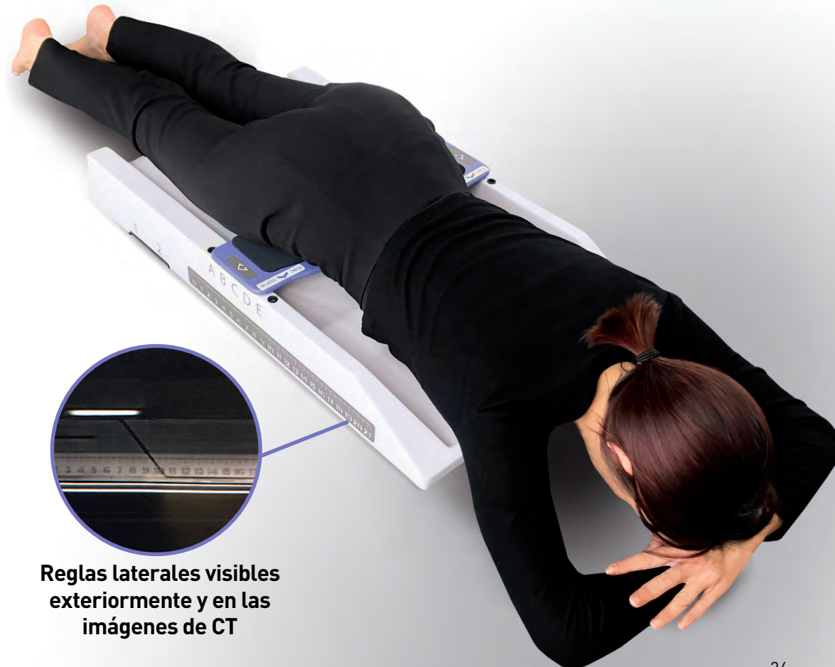
Reglas laterales visibles exteriormente y en las imágenes de CT